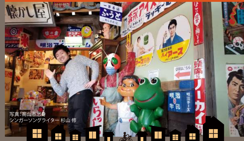
写真：高山市出身 シンガーソングライター 杉山修