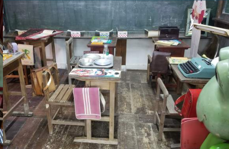
昭和の小学校では学校給食を食べていただけます