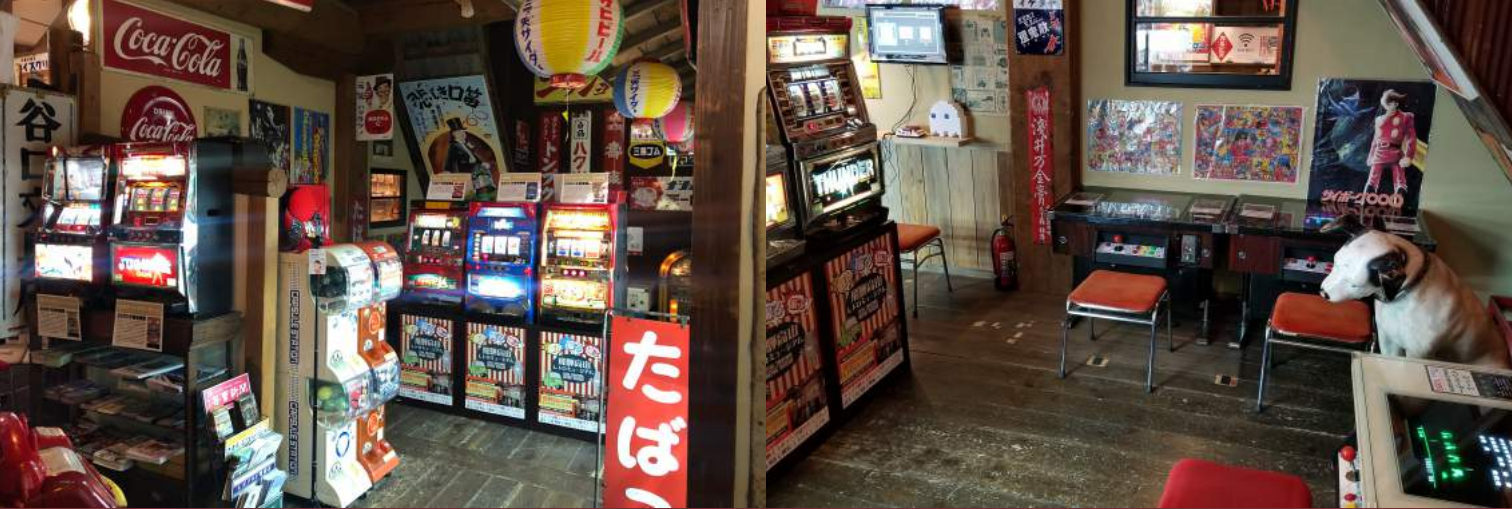
懐かしい20年前のレトロなスロットコーナー